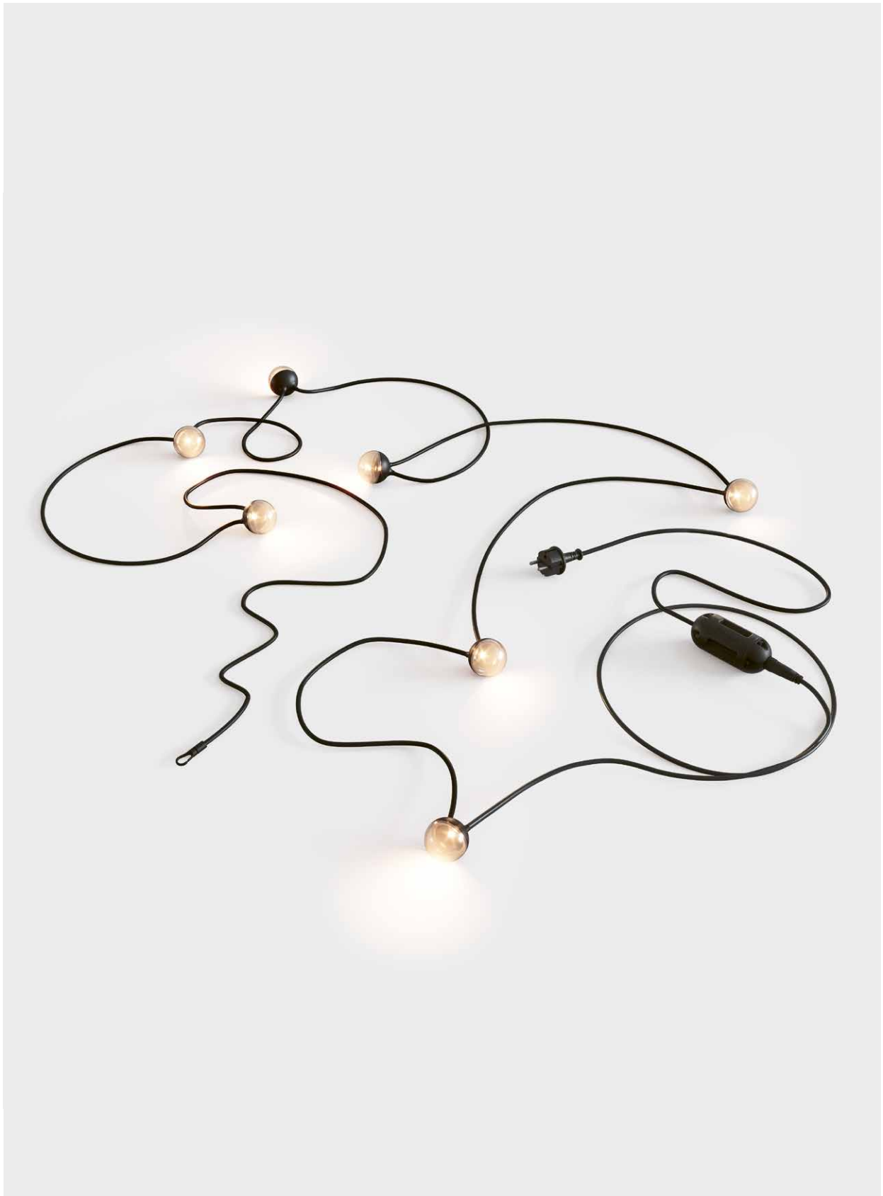
cherry bubbbs plug Design: Klaus Nolting